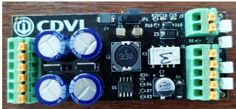
Carte n°2 : Carte ventouse